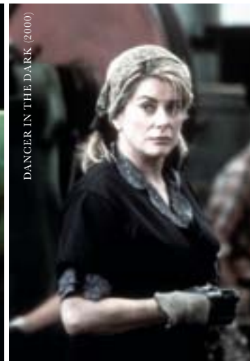
DANCER IN THE DARK (2000)