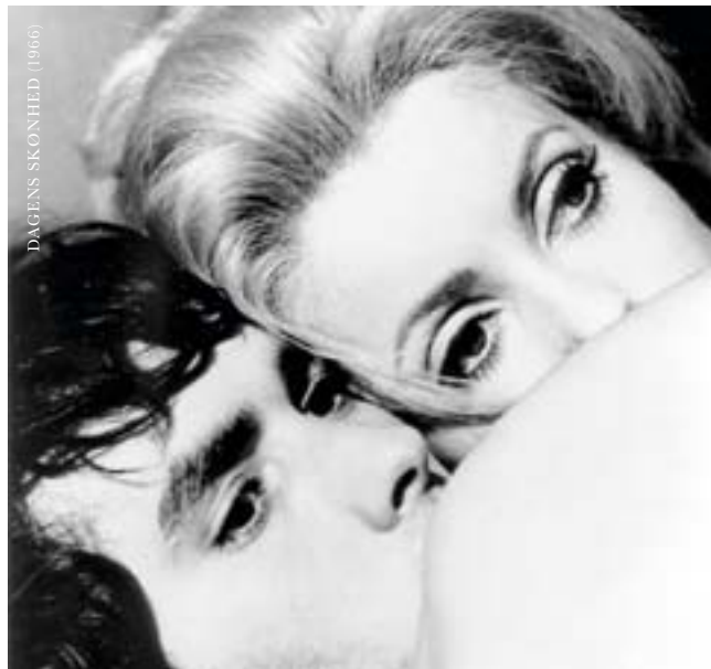
DAGENS SKØNHED (1966)