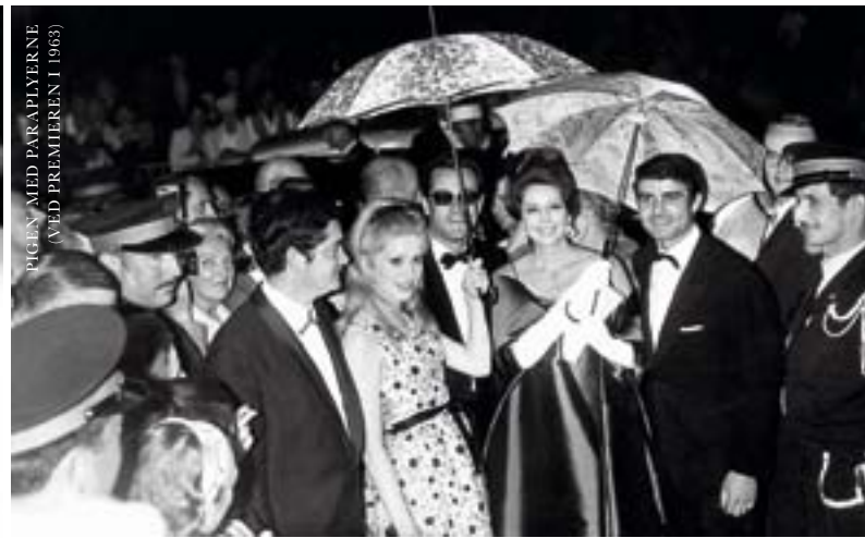
PIGEN MED PARAPLYERNE (VED PREMIEREN I 1963)