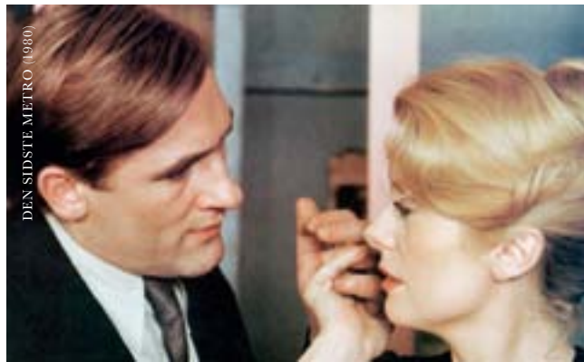
DEN SIDSTE METRO (1980)